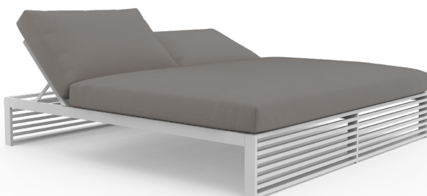
Cama chill DNA

Frente a la piscina, que se extiende bajo la terraza cubierta hasta casi colarse en el salón, se disponen generosas camas chill de la serie DNA , diseñadas por José A. Gandía-Blasco y realizadas con perfilera de aluminio termolacado en blanco. Sobre la estructura, cuyas lamas juegan a recrear las luces y sombras de las geometrías horizontales presentes en las obras de algunos arquitectos japoneses o en las contraventanas mediterráneas, descansan colchonetas rellenas de gomaespuma de poliuretano recubierta con tejido hidrófugo especial. Estas camas de exterior (daybeds) pueden moverse con facilidad para reconfigurar islas de bienestar tan cómodas y acogedoras como si de una estancia interior se tratara.