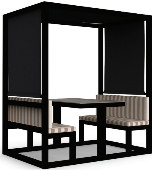
Merendero. Saint-Tropez sand