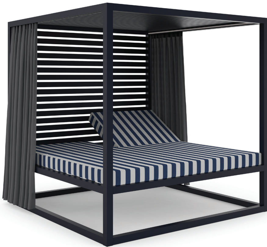
Daybed. Saint-Tropez navy

Riviera chic, el pulso del verano con Saint-Tropez