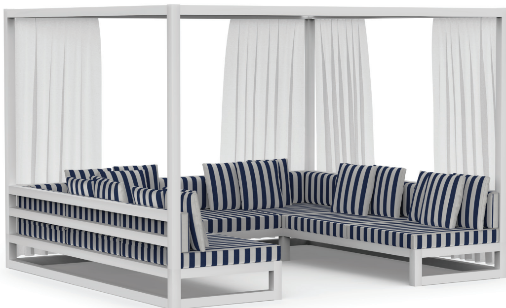
Pérgola Sofá. Saint-Tropez navy