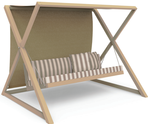
Nao-Nao. Saint-Tropez sand

Pensada para disfrutar del entorno sin preocupaciones, esta colección textil está fabricada con una ingeniería de materiales de alta resistencia , lo que la hace idónea tanto para proyectos residenciales como para entornos comerciales u hoteleros que exigen la máxima durabilidad ante ambiente marino y la exposición al sol. Confeccionados en 100% acrílico teñido en masa, estos tejidos técnicos poseen una elevada solidez a la luz y un acabado resistente a los rayos ultravioleta (UV). Son aptos para exterior y resisten la exposición a la lluvia, al tiempo que mantienen un tacto sorprendentemente suave y agradable, garantizando un confort excepcional a cielo abierto. La paleta cromática de las rayas, con opciones profundas como el negro y el azul noche, se ha diseñado para combinar a la perfección con los tonos esenciales de las estructuras de aluminio de GANDIABLASCO , abarcando desde los colores neutros y suaves hasta las opciones más oscuras. Saint-Tropez logra un equilibrio perfecto entre la memoria estética del pasado y la innovación del presente, creando ambientes exteriores totalmente adaptables a entornos interiores que respiran una elegancia universal y atemporal.