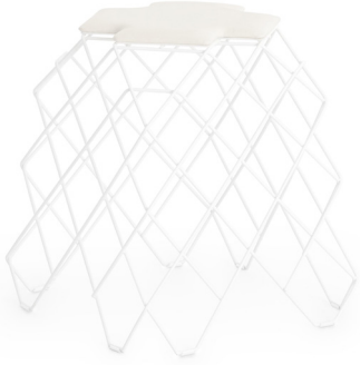
taburete R24 white