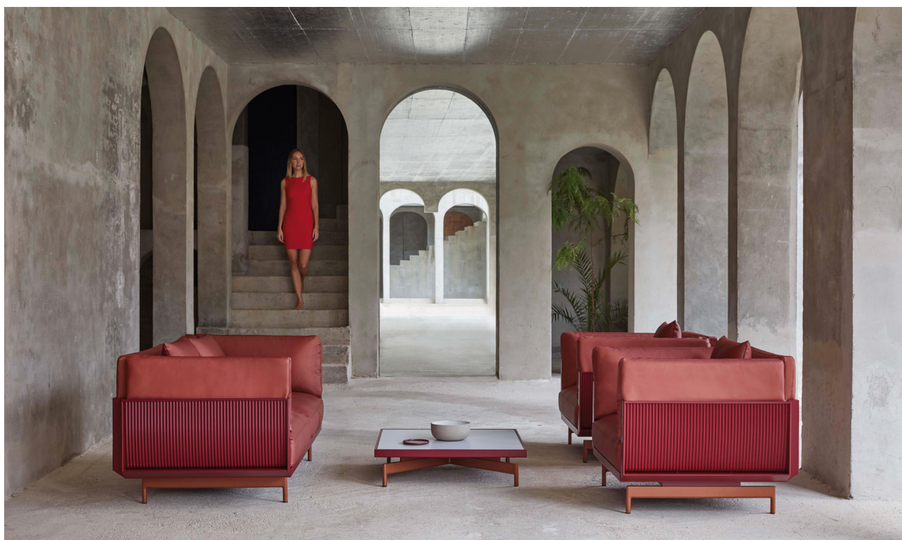
Composición ONDE. Ambientes indoor-outdoor

Diseñada por Luca Nichetto , plasma la dicotomía del creador establecido en Estocolmo pero nacido en Venecia: funcionalidad escandinava combinada con la calidez y minuciosidad que caracterizan al diseño italiano. Nichetto propone con ONDE ambientes híbridos indoor-outdoor con marcado carácter arquitectónico . Que han conquistado el onírico espacio de la casa-taller de Xavier Corberó. Y es que "la relación entre producto y entorno es muy importante, y por eso la arquitectura y el diseño están tan estrechamente relacionados."