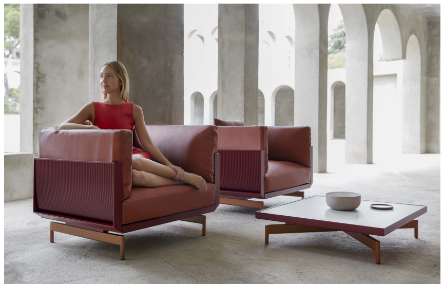
Sillones y mesa baja cuadrada ONDE