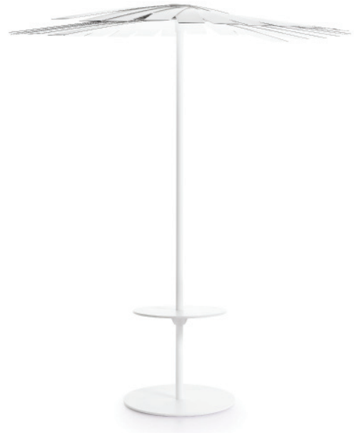
Mesa auxiliar ENSOMBRA

Por otro lado, la base de ENSOMBRA puede incorporar un puf redondo de grandes dimensiones que permite generar áreas de descanso. Este, a su vez, puede sumar un respaldo que abraza al mástil, más una bandeja opcional en su parte superior. Tanto el asiento como el respaldo están tapizados con tejido técnico para exteriores y cuentan con un relleno de poliuretano de secado rápido Gravidry®.