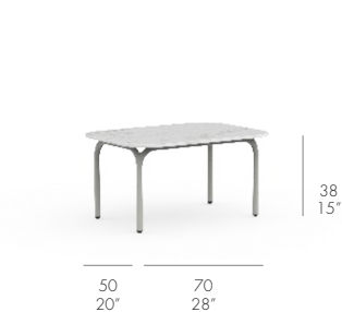
MESA TUMBONA *NEW