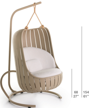
SWING / COLUMPIO