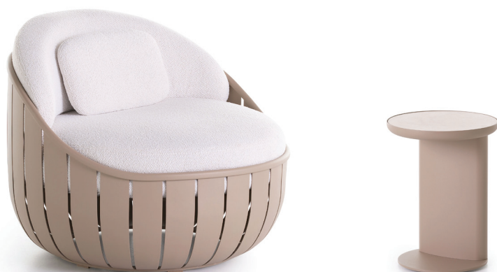
Sillón, Mesa Auxiliar ARENA

El proceso de producción comienza con el corte por láser de las lamas en una plancha de aluminio. Una vez cortadas, las lamas se someten a un proceso de curvado en dos máquinas diferentes, que proyectan el patrón de curvatura deseado y presanan individualmente