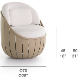
CLUB CHAIR / BUTACA