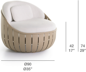
LOUNGE CHAIR / SILLÓN