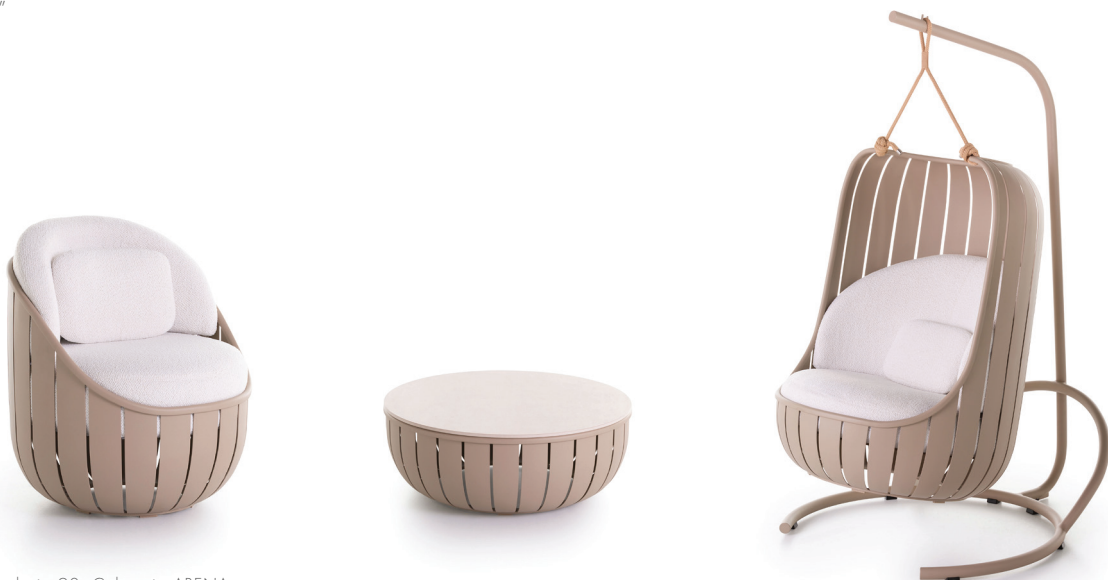
Butaca, Mesa baja 90, Columpio ARENA

"ARENA me ha permitido aprovechar la excepcional artesanía y trabajo industrial de GANDIABLASCO, retándonos a crear piezas técnicamente ambiciosas pero estéticamente adecuadas, que cumplen la misión y los valores de la empresa. Con su enfoque innovador del diseño y su compromiso inquebrantable con la calidad, esta colección invita a entregarse a la belleza y el confort de la vida al aire libre."