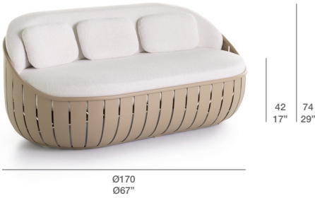
2 SEAT SOFA / SOFÁ 2 PLAZAS