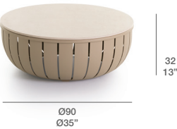
COFFEE TABLE / MESA BAJA