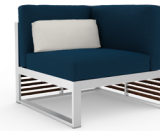
Respaldo alto. High backrest