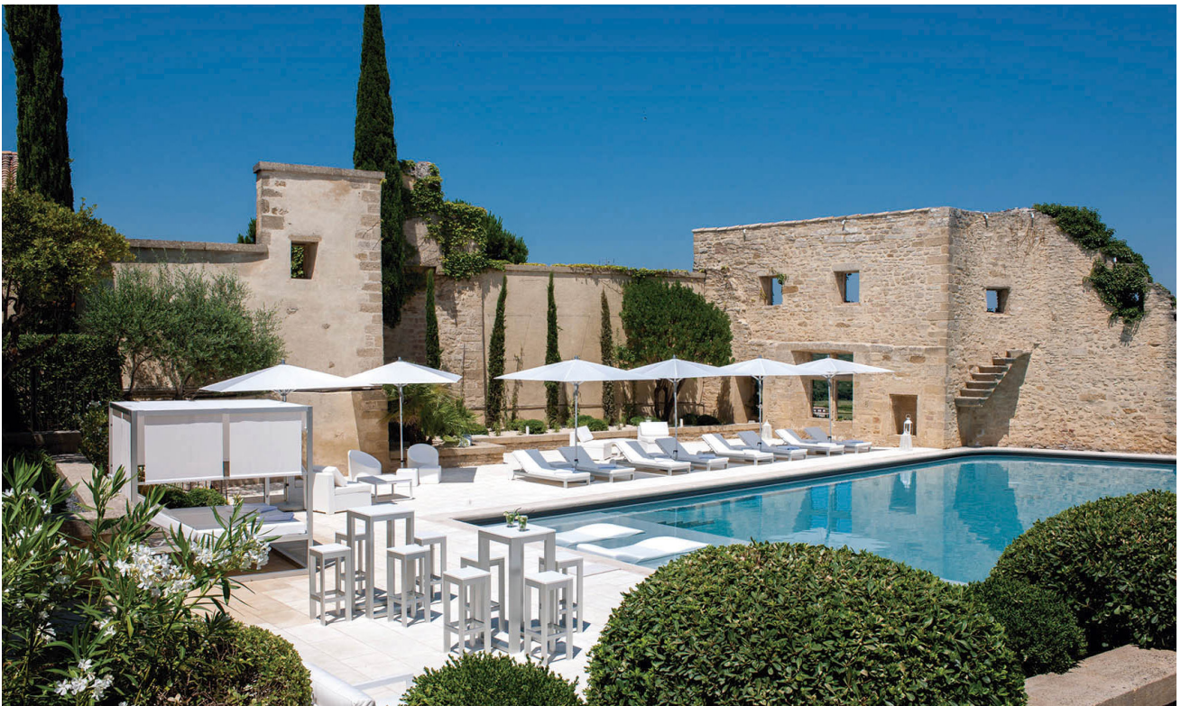
Localización: Castillon-du-Gard, Francia Colecciones: Na Xemena, Daybed / 356, Lipstick (Diabla)

El castillo aguarda un mágico refugio rodeado por los muros medievales, la zona exterior equipada con las colecciones de exterior de GANDIABLASCO. Las tumbonas de exterior crean el espacio donde descansar frente a la piscina, mientras que las butacas y mesitas LIPSTICK , de José A. Gandía-Blasco Canales para Diabla, ofrecen un lugar desenfadado donde sentarse a leer o tomar café inmerso en esa idílica atmósfera. Fabricadas en polietileno proveniente exclusivamente de fuentes recicladas, son ligeras, fáciles de mantener y durables por su alta resistencia a la intemperie y a la corrosión.